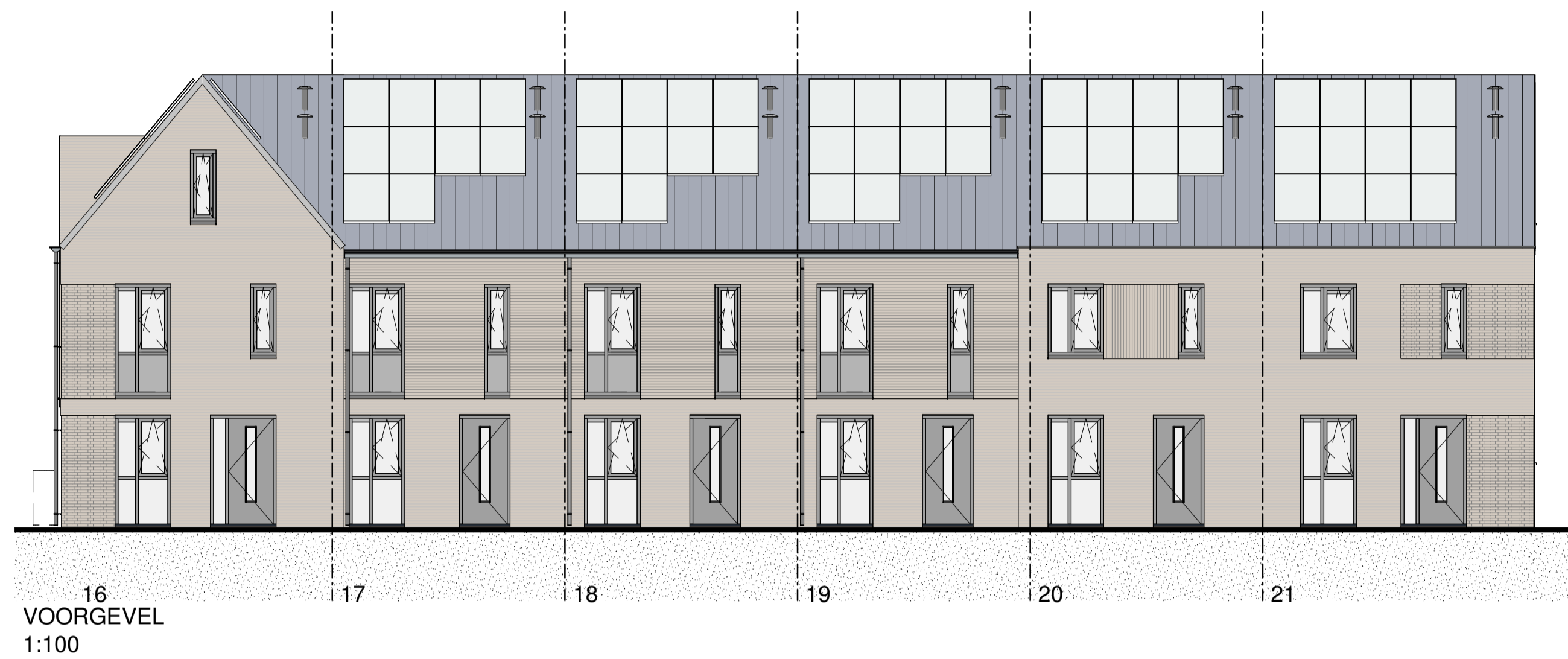
16 VOORGEVEL 1:100