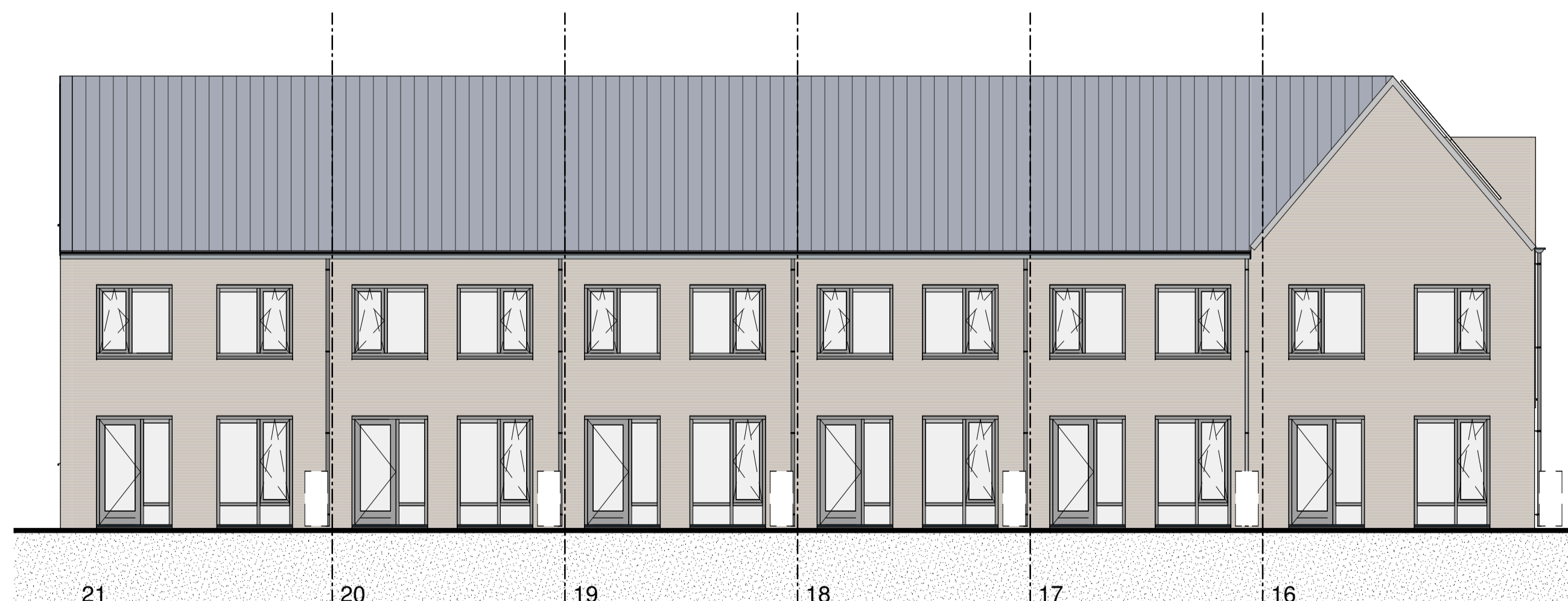
21 ACHTERGEVEL 1:100