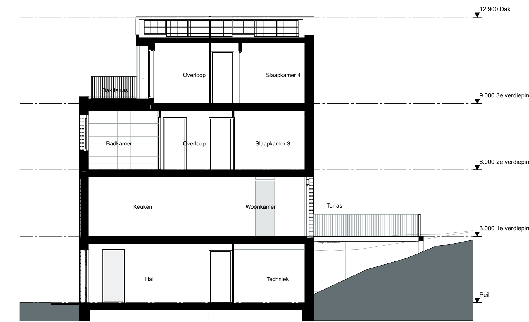
Doorsnede B Schaal 1:100