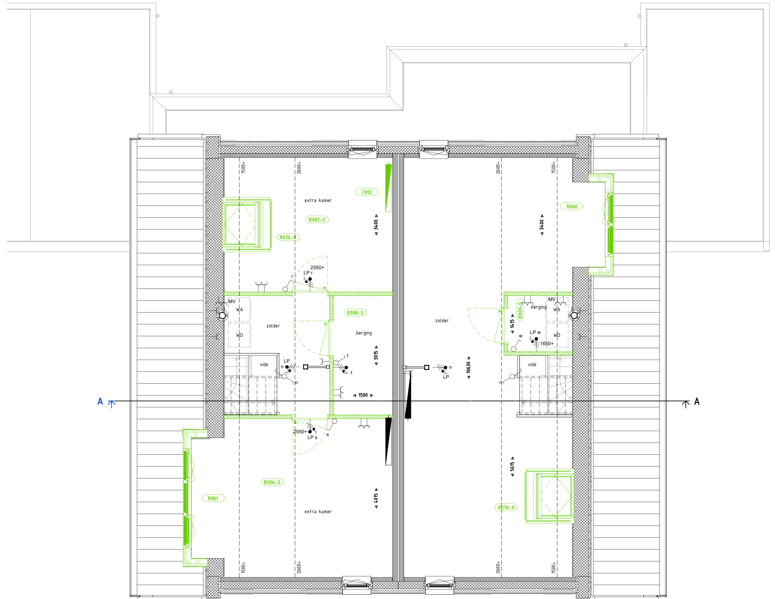
Bouwnummer 65 Bouwnummer 66

B006-S - Zolder - Extra kamer A B007-S - Zolder - Extra kamer B B008-S - Zolder - Extra bergruimte A R067 - Dakwapel - 3 raams R070-V - Dakraam Velux - 1140x1180 mm C002 - Zolder - Radiator B009-S - Zolder - Extra bergruimte B B066 - Dakwapel - 2 raams R070-V - Dakraam Velux - 1140x1180 mm