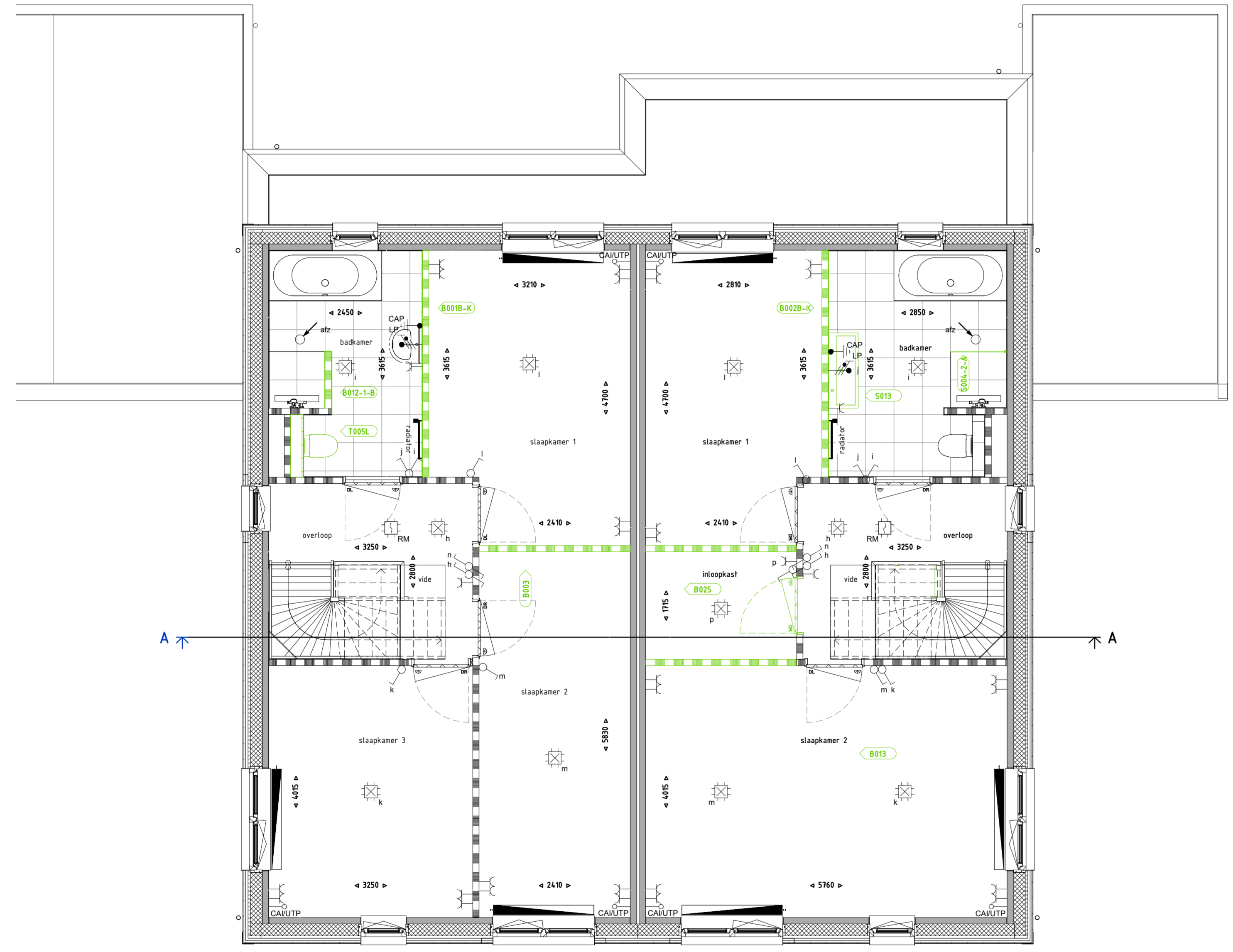
Bouwnummer 65 Bouwnummer 66

B001B-K - Badkamer 300 mm vergroten - Luxe T005L - Badkamer - Afritsmuren inbouwreserver tot plafond - Luxe B012-LB - Badkamer - Tussenvand plaatsen - Positie 1 - Tegelvloer Luxe B003 - Verdieping - Verplaatsen tussenvand slaapkamers B002B-K - Badkamer - 700 mm vergroten - Luxe S004-2-A - Badkamer - Glazen douchewand - Positie 2 - Helder glas S013 - Badkamer - Plaatstenen wastafel 100 cm - Luxe B013 - Verdieping - Vervallen kin slaapkamer B005 - Verdieping - Inloopkast