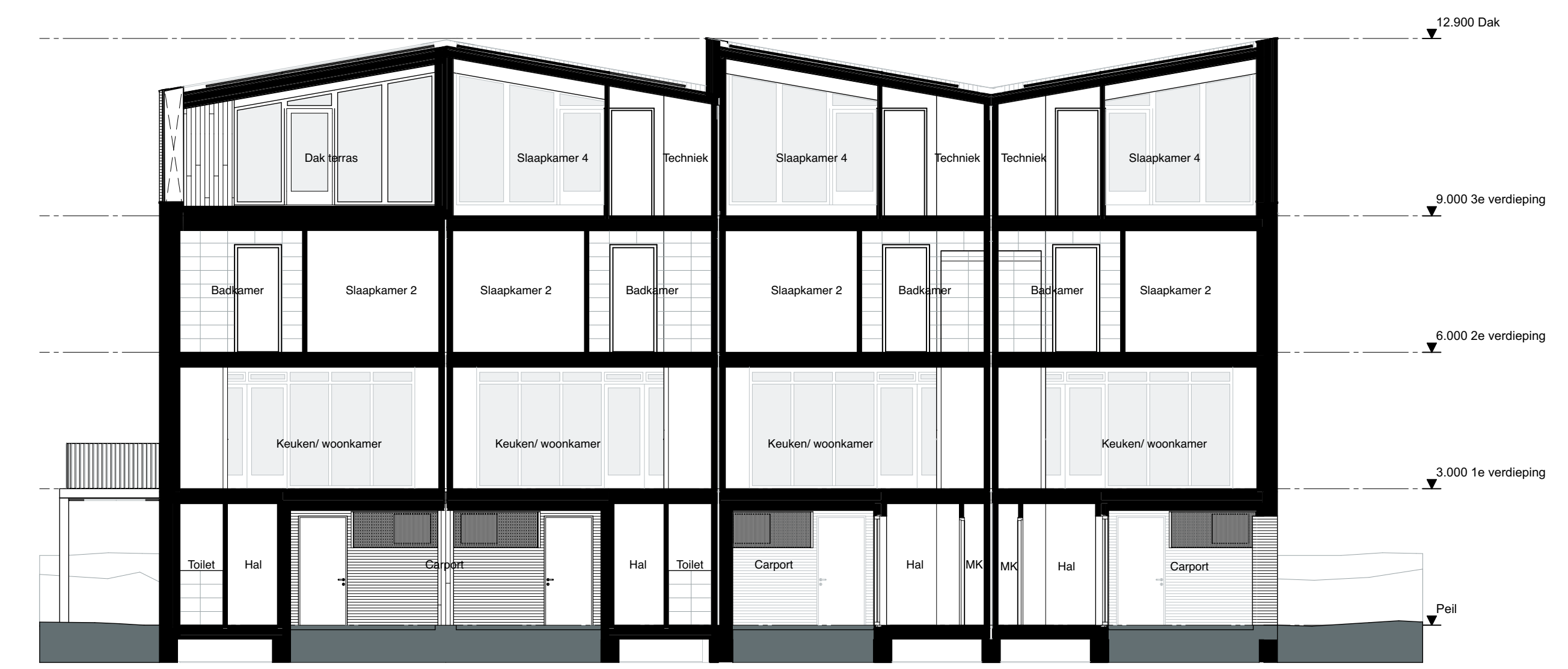
Doorsnede A Schaal 1:100