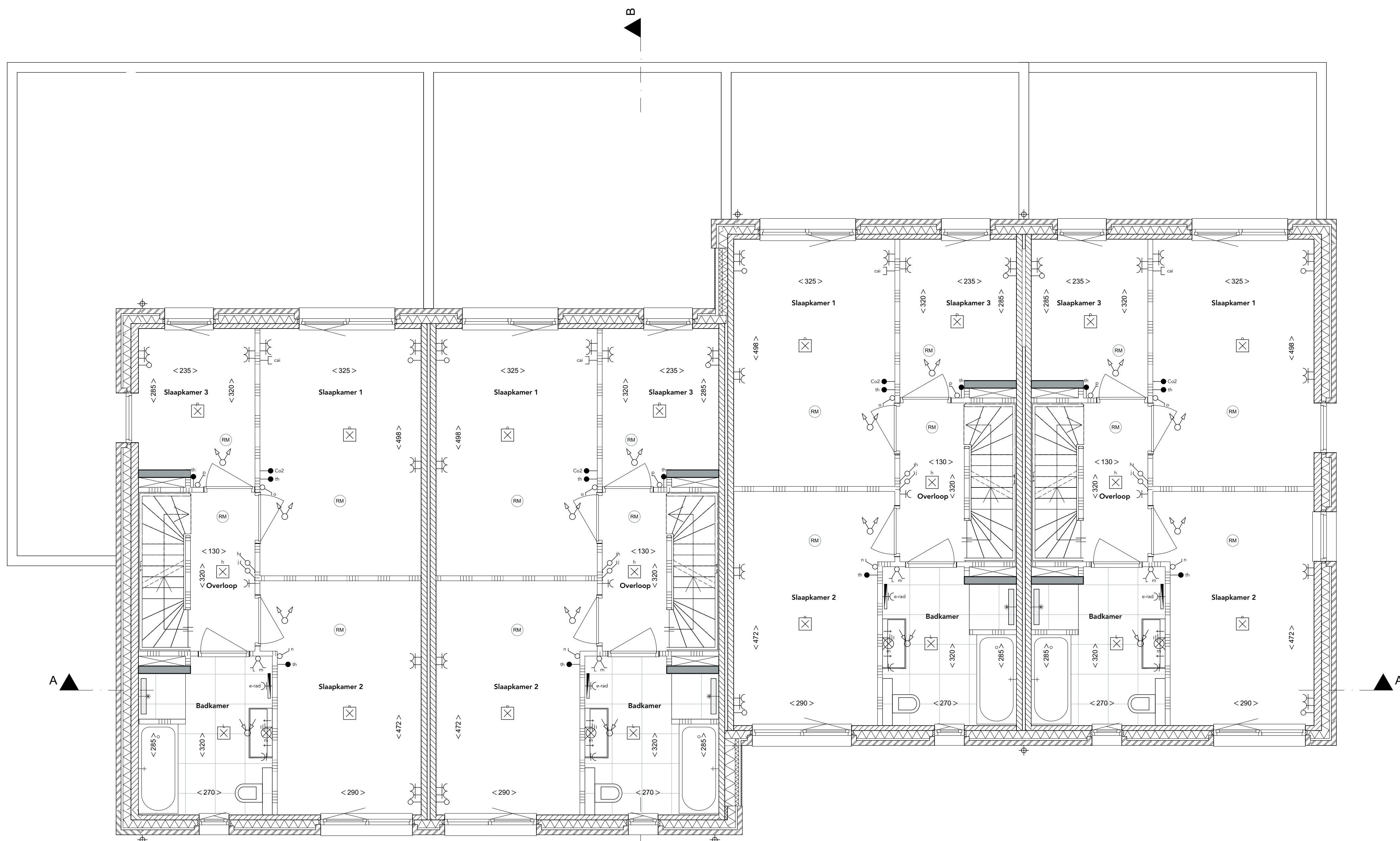
2e verdieping Schaal 1:50