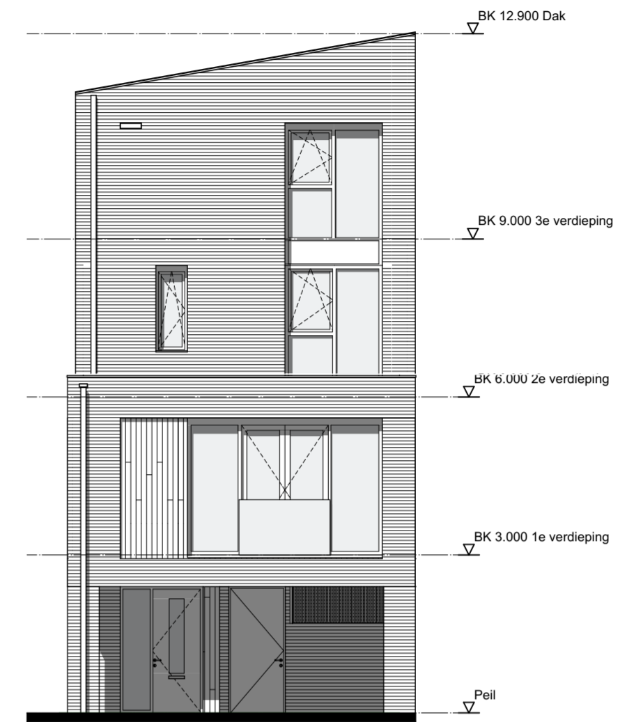
Voorgevel Schaal 1:100