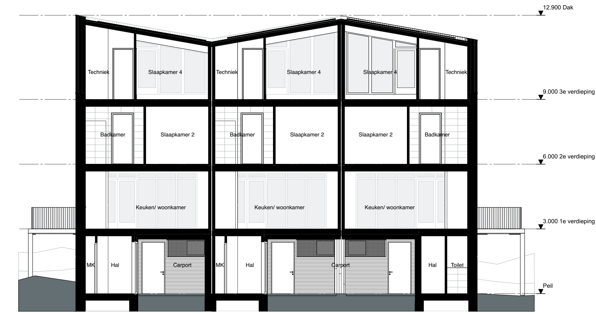
Doorsnede A Schaal 1:100