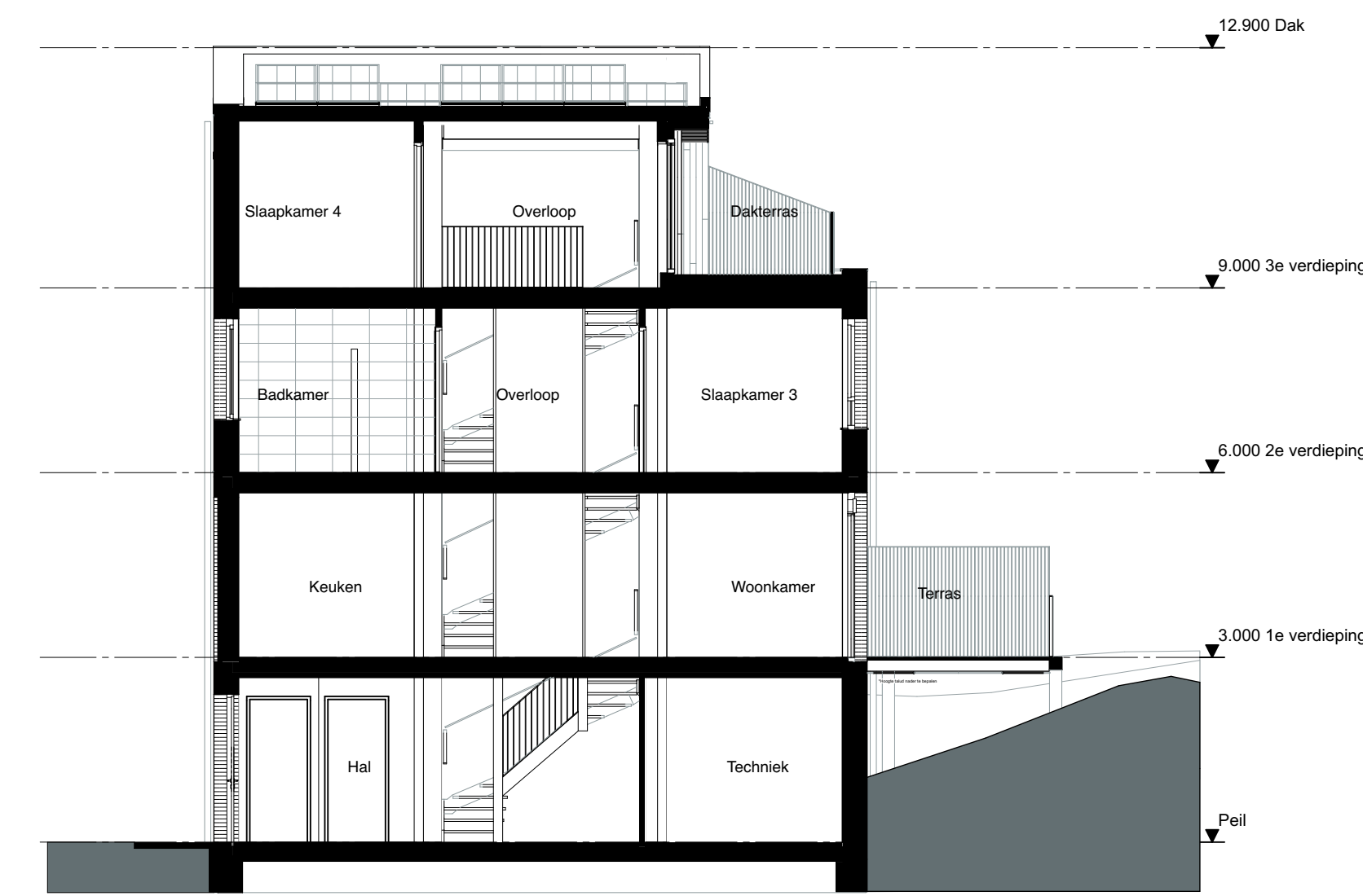
Doorsnede B Schaal 1:100