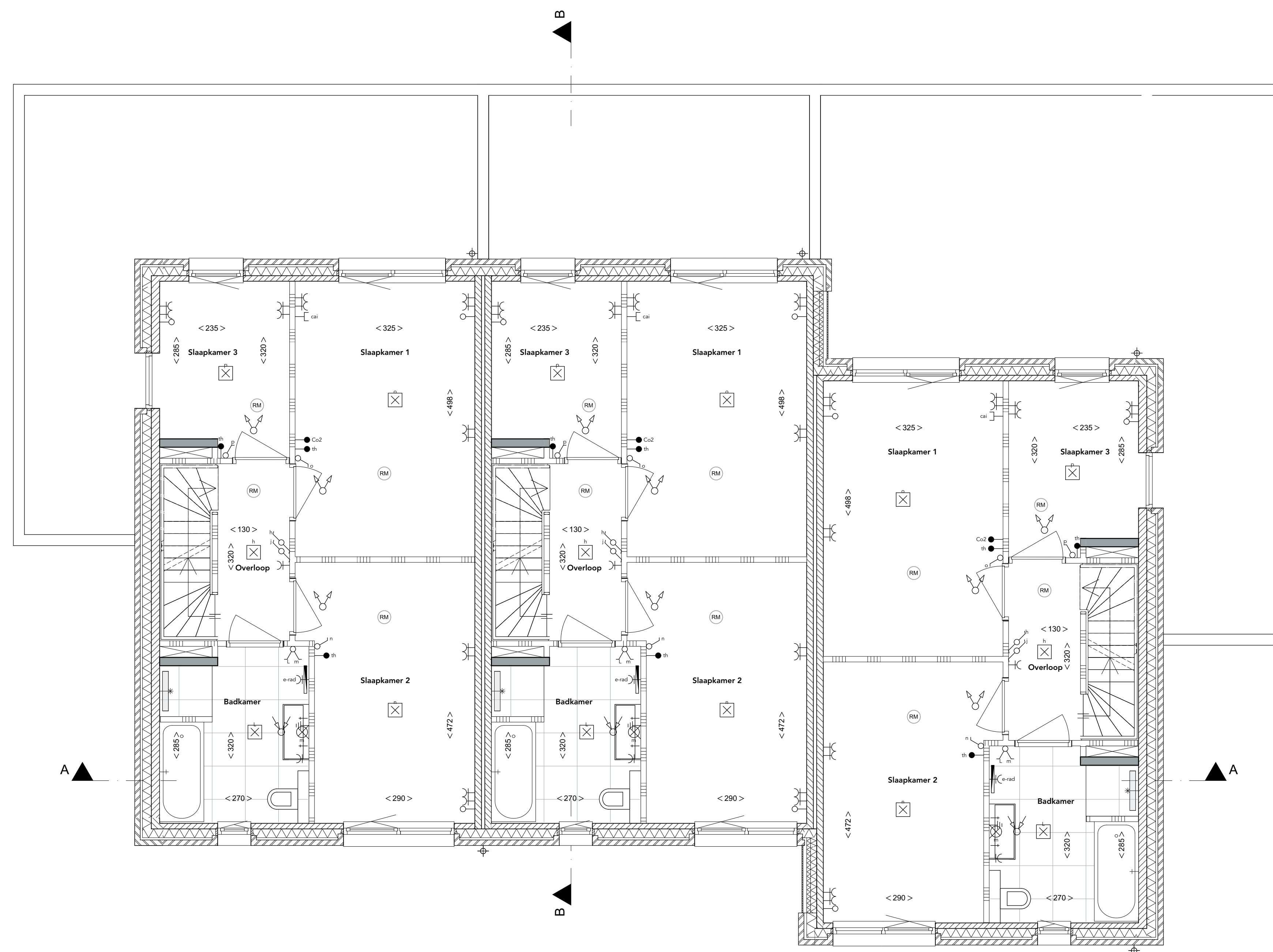
2e verdieping Schaal 1:50