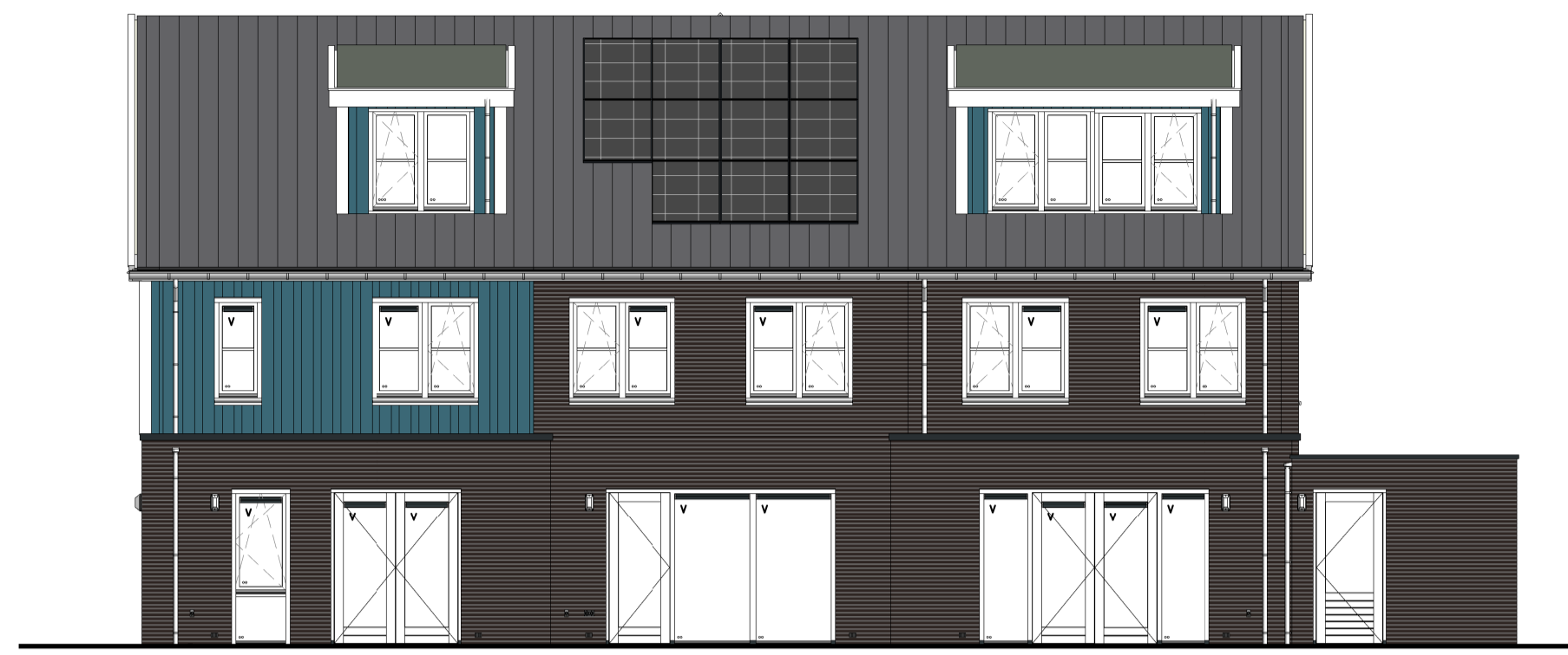
Bouwnummer 10 ACHTERGEVEL 1 : 100