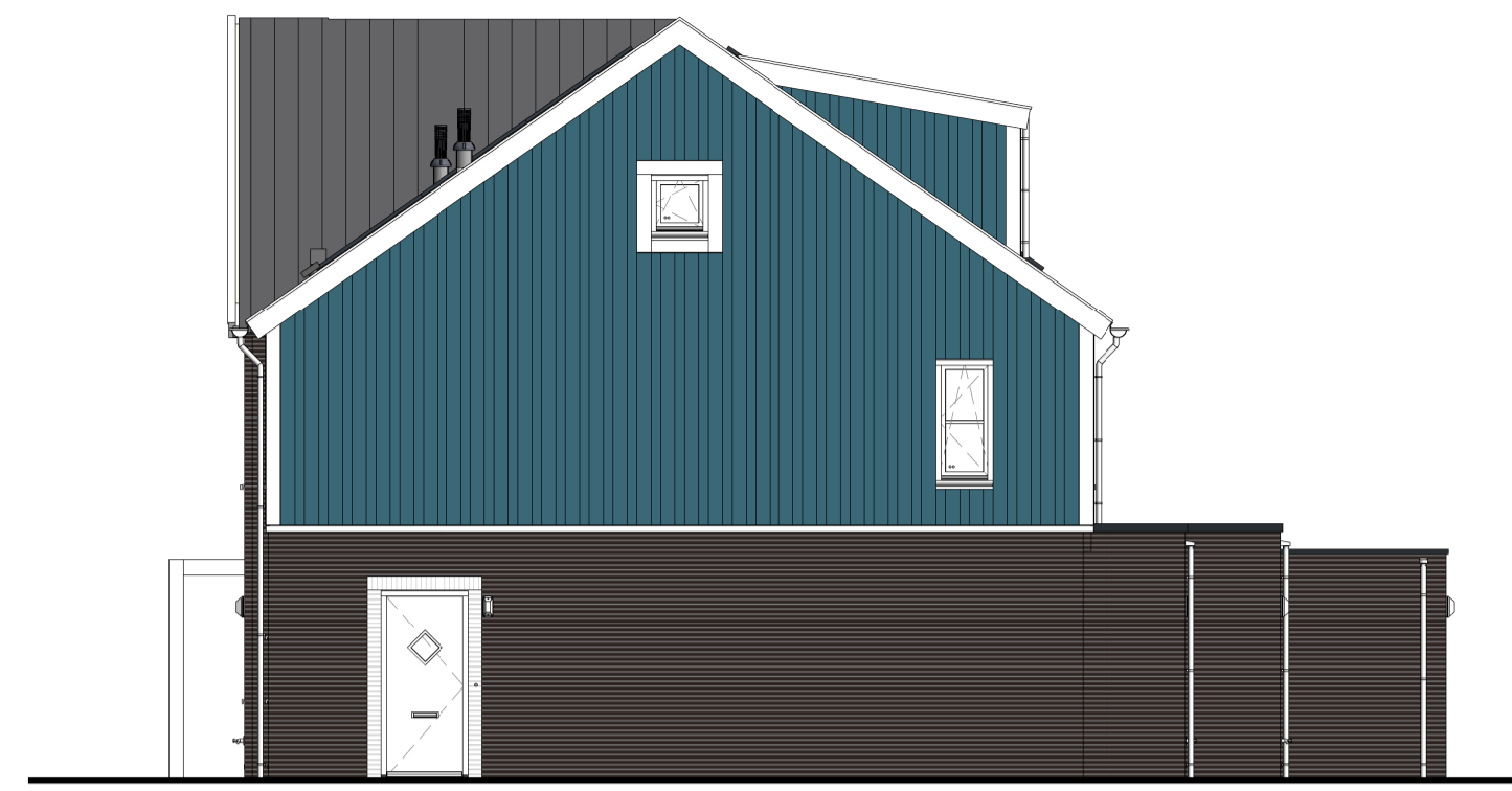
RECHTERZIJGEVEL 1 : 100